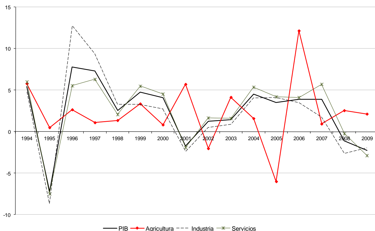
Gráfica 1. Tasas de crecimiento del PIB (%) en México, por sector, 1994 a 2009