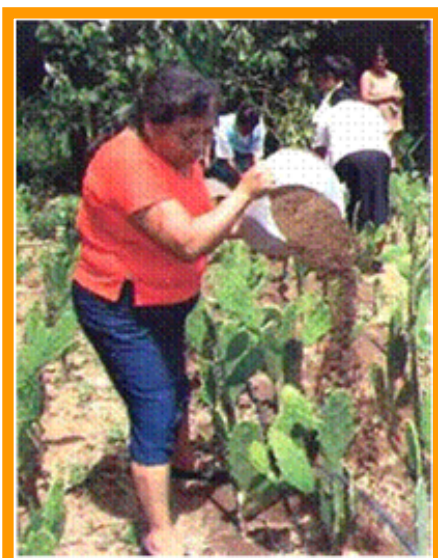
La aplicación de composta es una práctica que las mujeres emplean en la producción orgánica de nopal

A través de la SAGARPA se les apoyó para iniciar un proyecto de procesamiento de nopal, en presentaciones de salmuera y escabeche, para ello primero realizaron el mejoramiento genético del cultivo y el manejo orgánico de la producción en donde se incorporaron prácticas modernas como: el arreglo de la distribución de plantas en el terreno, riego por goteo, desarrollo de compostas para fertilización, entre otras, logrando mejorar la calidad y el rendimiento, aspectos que en el futuro permitieron la certificación de su producto y un mejor precio en el mercado. También se realizaron procesos de capacitación para manejar y administrar la empresa.