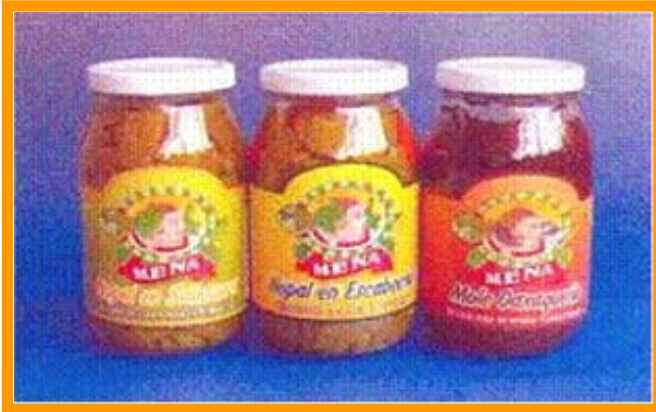
Los productos de Ayoquezco son los primeros resultados de una larga gestión que las mujeres decidieron realizar

Desde el cultivo hasta la industrialización de la materia prima, este grupo de mujeres, logró no solo sobrevivir a sus circunstancias y al abandono de sus parejas, sino que han logrado convertir su experiencia en un caso de éxito, mejorando sus condiciones de vida, la de sus familias y proyectándose hacia un mejor futuro.