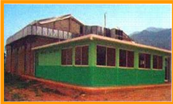
La mezcla de recursos permitió la construcción de una planta de procesamiento tipo FDA