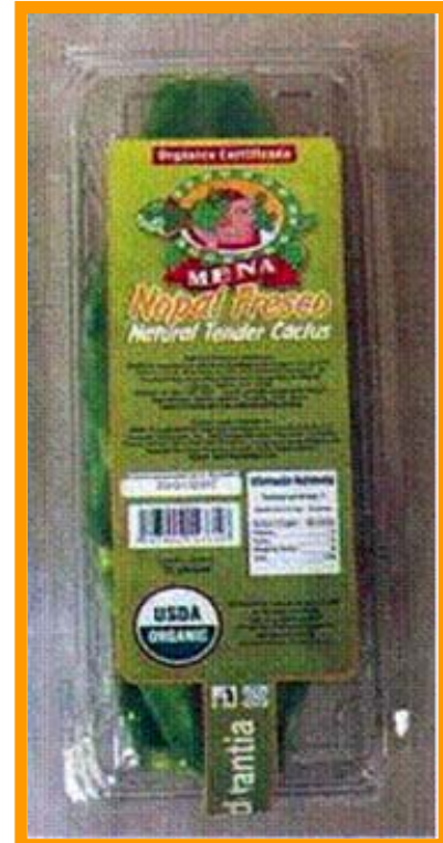
Los nopales de Ayoquezco cuentan con certificación orgánica que le permite su comercialización en Estados Unidos y la Unión Europea.