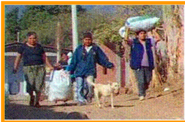
Mujeres de Ayoquezco afectadas por el fenómeno de la migración

Así se dio inicio a la migración de los varones de esta zona a los Estados Unidos, en busca de un mejor futuro, para ellos y las familias que dejaban.