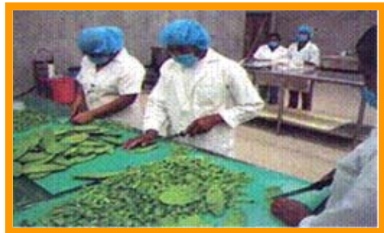
Las mujeres de Ayoquezco tienen que cumplir un específico control de calidad en el procesamiento de su producto

El aprovechamiento que realizaron las mujeres de Ayoquezco de las oportunidades de su entorno ha sido resultado de su participación democrática y equitativa, de un fuerte liderazgo y de su visión en torno a un proyecto común. Así como de una atinada asesoría que impulsa entre otros factores: