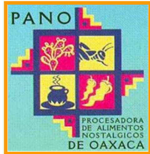
PANO es resultado de una alianza estratégica hecha entre los emigrantes y MENA

Mediante la gestión de otros apoyos lograron una mezcla de recursos; provenientes de la Secretaría de Desarrollo Social, la Secretaría de Agricultura, Ganadería, Desarrollo Rural, Pesca y Alimentación (SAGARPA), el Fondo Multilateral de Inversión del Banco Interamericano de Desarrollo y la Fundación Interamericana. Con lo cual construyeron y equiparon recientemente una planta para la industrialización y elaboración de sus productos, tanto para su venta local como para la exportación. Dicha industrializadora recibió su registro por la Food and Drug Administration (FDA), cumpliendo con todas las normas internacionales para la producción de alimentos, lo que les amplía el horizonte y su potencial mercado hacia los Estados Unidos, con productos certificados de acuerdo a las normas de calidad de ese país.