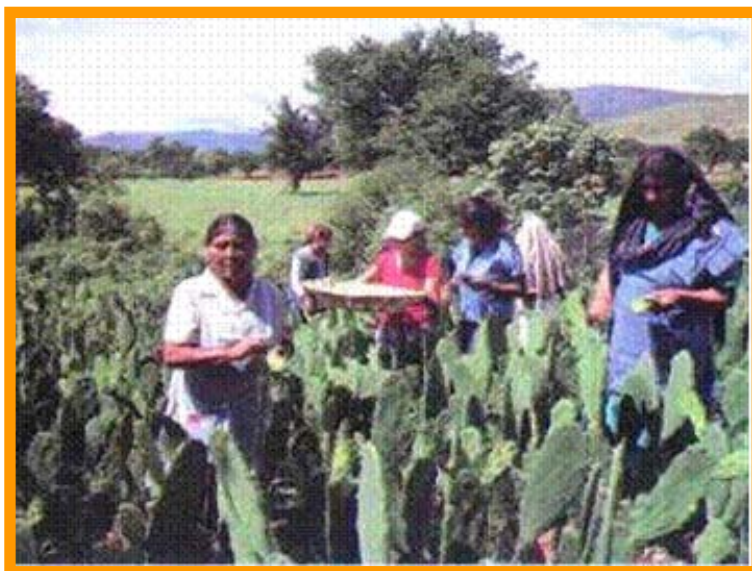
El mejoramiento genético del nopal fue el primer paso dentro del proyecto

A través de la SAGARPA se les apoyó para iniciar un proyecto de procesamiento de nopal, en presentaciones de salmuera y escabeche, para ello primero realizaron el mejoramiento genético del cultivo y el manejo orgánico de la producción en donde se incorporaron prácticas modernas como: el arreglo de la distribución de plantas en el terreno, riego por goteo, desarrollo de compostas para fertilización, entre otras, logrando mejorar la calidad y el rendimiento, aspectos que en el futuro permitieron la certificación de su producto y un mejor precio en el mercado. También se realizaron procesos de capacitación para manejar y administrar la empresa.