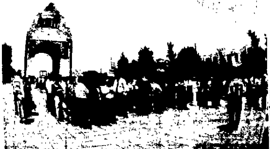
PERSONAL de oficinas y algunos vecinos participaron en el simulacro de alerta antisísmica, ayer, en la Plaza de la República.

El Comité Nacional del Servicio Electoral y Membresía perredista convocará a un pleno extraordinario en noviembre para tomar la protesta a López Obrador como aspirante presidencial.