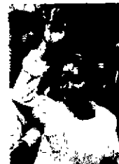
Elba Esther Gordillo, luego de su conferencia de prensa